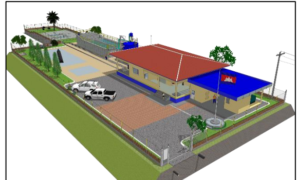
【浄水場完成予想図】