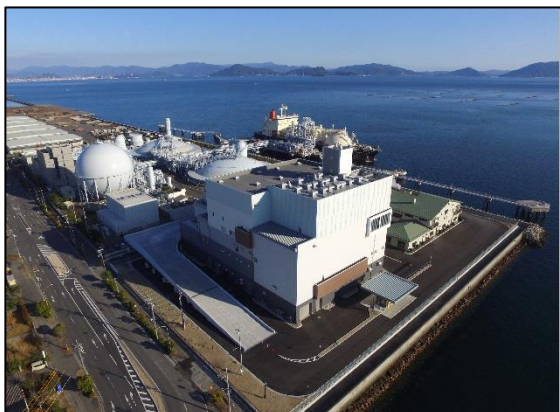
はつかいちエネルギークリーンセンターの外観