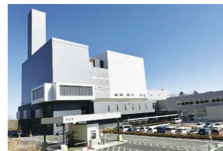
2023年3月、埼玉西部クリーンセンター竣工