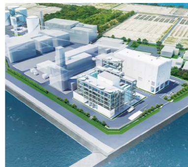
2021年10月、兵庫東流域下水汚泥広域処理場汚泥処理施設改築工事を受注(建設中)