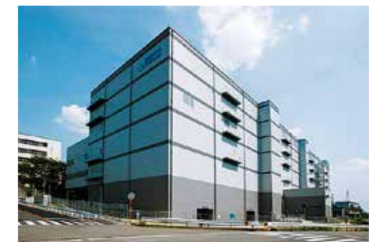
中間貯蔵・環境安全事業(株)豊田PCB処理事業所殿向PCB処理施設

PCB(ポリ塩化ビフェニル)は無色透明の油状の化学物質です。電気機器の絶縁油などさまざまな用途で利用されましたが、人体への悪影響が判明し、現在は製造が禁止されています。長く有効な処理方法もありませんでしたが、当社はPCBを無害化処理する技術を開発。施設的设计・建設・メンテナンスを通じて、負の遺産を次世代へ残さない取り組みを続けています。