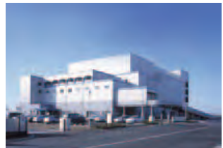
▲宮城県 石巻広域クリーンセンター 115t/日×2炉