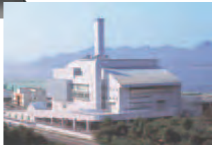
▲広島県 安芸クリーンセンター 65t/日×2炉