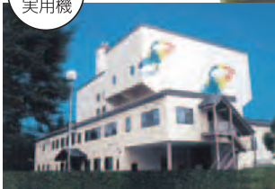
▲青森県 中部上北清掃センター 30t/日×2炉