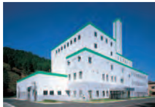
▲秋田県鹿角 環境衛生センター 30t/日×2炉