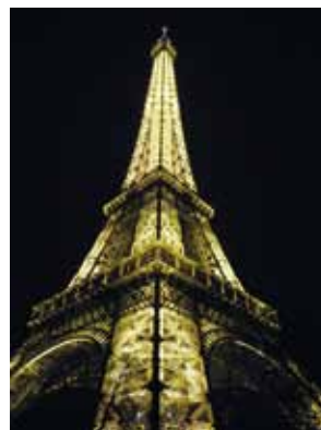
ライトアップされたエッフェル塔