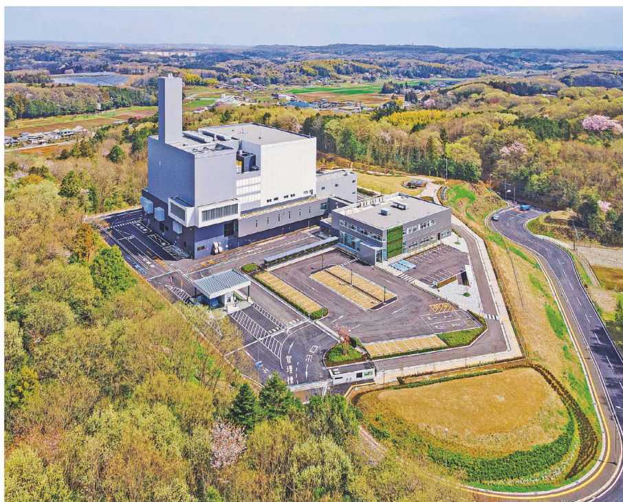
埼玉西部クリーンセンターの外観