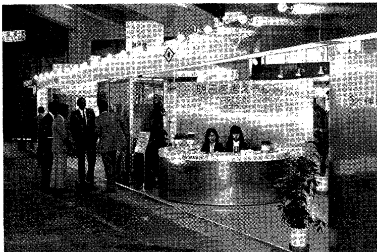
10小間にわたって出品展示

当社は、この展示会に縦軸エアレーション方式によるシグマディッチの実機(モックアップ)と模型、省エネ型ばっ気装置SPジェット(模型)およびAW脱臭装置(模型)を出品展示し多数の来場者があった。なお、出品は神鋼グループとして(株)神戸製鋼所と共同出品した。