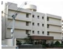
<甲南寮外観> 本社まで電車で20分

本社・播磨製作所・技術研究所の近くに独身寮（エアコン・家具付、一人部屋）を完備しています。寮には朝・夕食が提供される食堂が付いています。不安なことがあれば寮監が親身にサポート。慣れない社会人生活も、生活面の安全・安心を提供します。