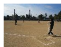
<野球クラブ練習風景>

財形貯蓄、従業員持株会、保養所、スポーツクラブの割引利用等、充実した福利厚生で従業員の将来設計や健康増進をサポートしています。