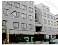
<魚住寮外観> 播磨製作所まで車で15分

※入寮は、会社規定で定める特定の要件を満たした方が対象となります。（詳細は説明会などでお尋ねください）