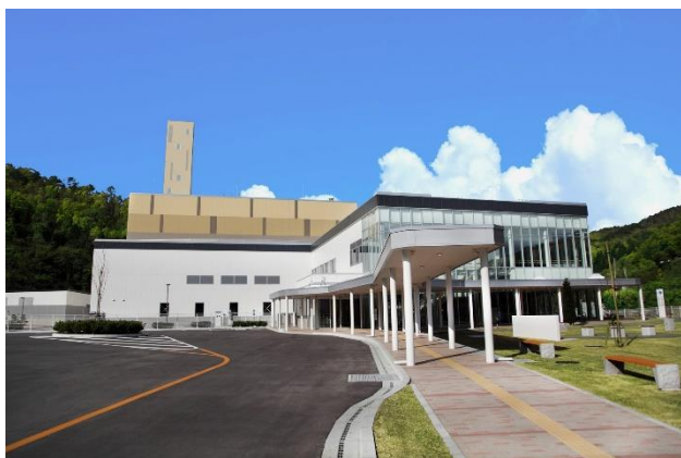
エネルギー回収施設（川口）の外観