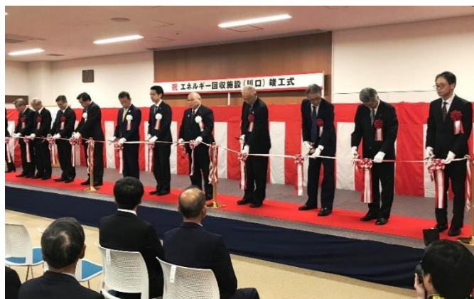
竣工式でのテープカットの様子