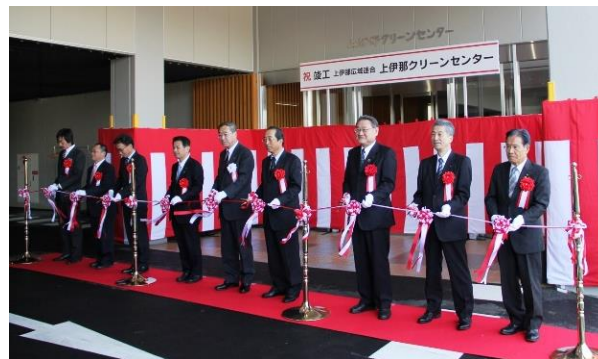
竣工式でのテープカットの様子