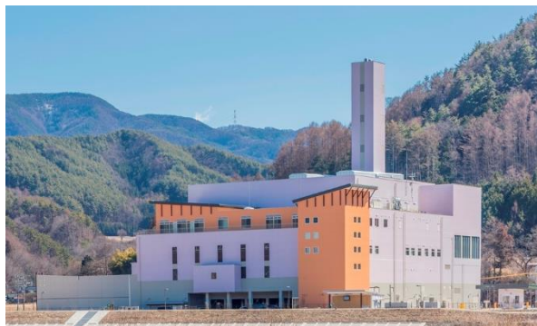
上伊那クリーンセンターの外観