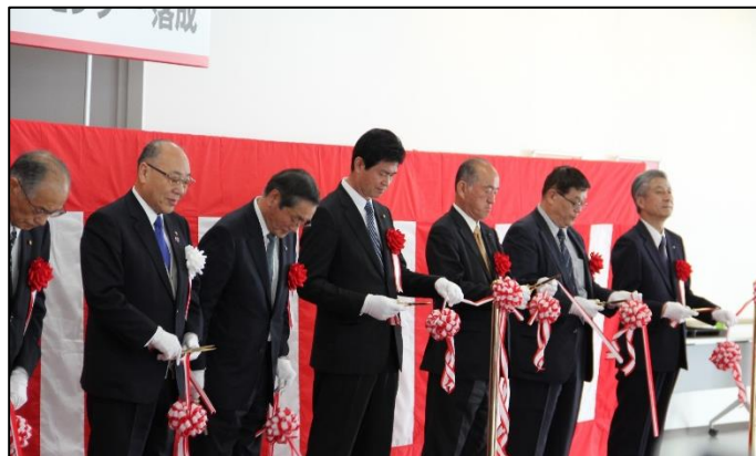
落成式でのテープカットの様子