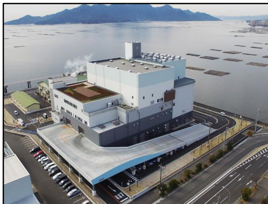
はつかいちエネルギークリーンセンターの外観